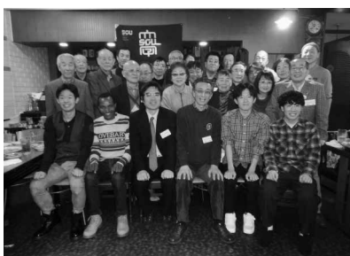
2019年12月 江別支部忘年会

予定していた事業計画は、ほとんどが中止せざるを得ない状況でしたが、月の第4水曜日に実施している「四水会」は、コロナ感染症の状況を注視しながら6月～10月までは開催する居酒屋でも席の距離確保、対面シールドの設置、窓を開け換気をする等の対応がありましたので参加者も感染防止策に留意しながら、何とか実施できました。しかし11月からは寒く窓を開けての換気が不十分となること等、再度感染者が増加し始めたので中止することになりました。