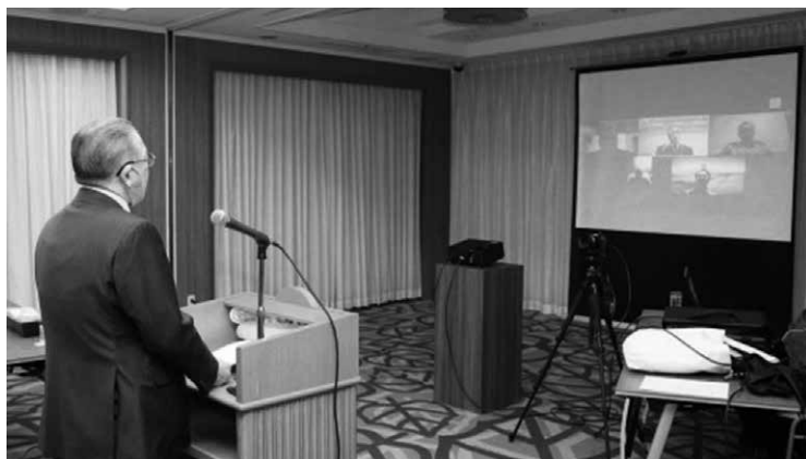
オンライン会議の様子