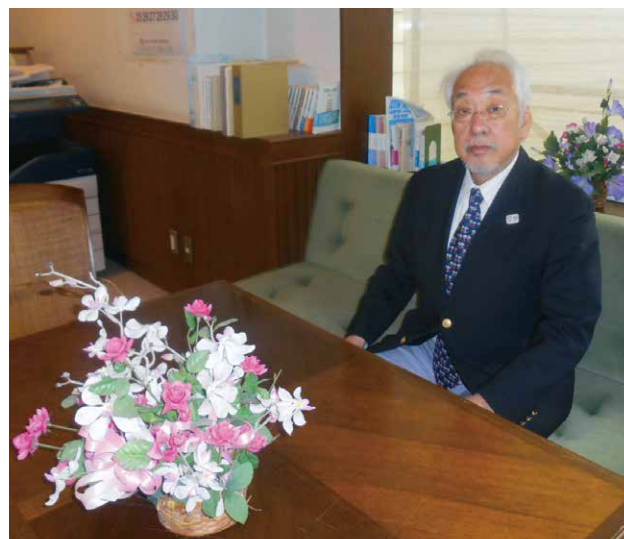
札幌学院大学文泉会